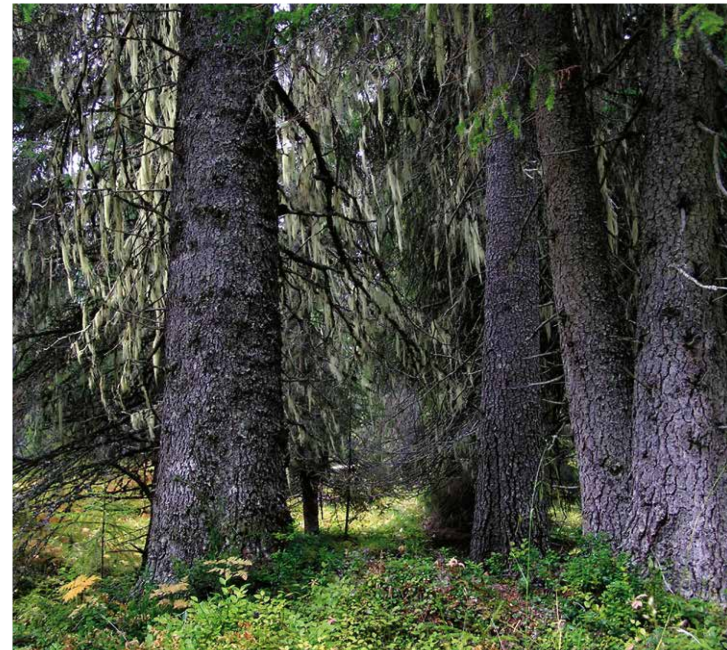
... till exempel den imponerande fjällskogen.