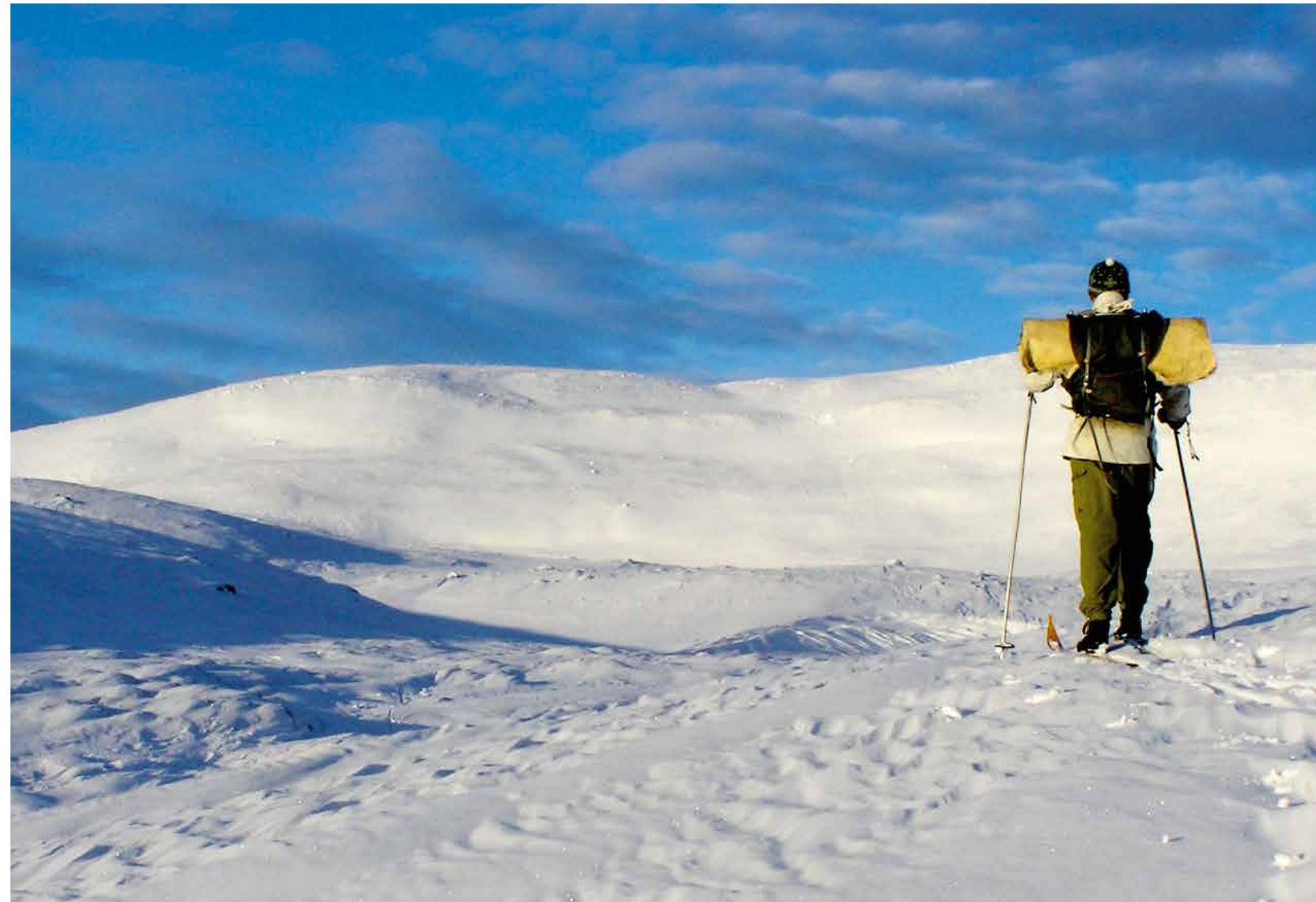
En skidtur på Transtrandsfjällens fjällhed erbjuder fina vyer, men det finns mer att se ...