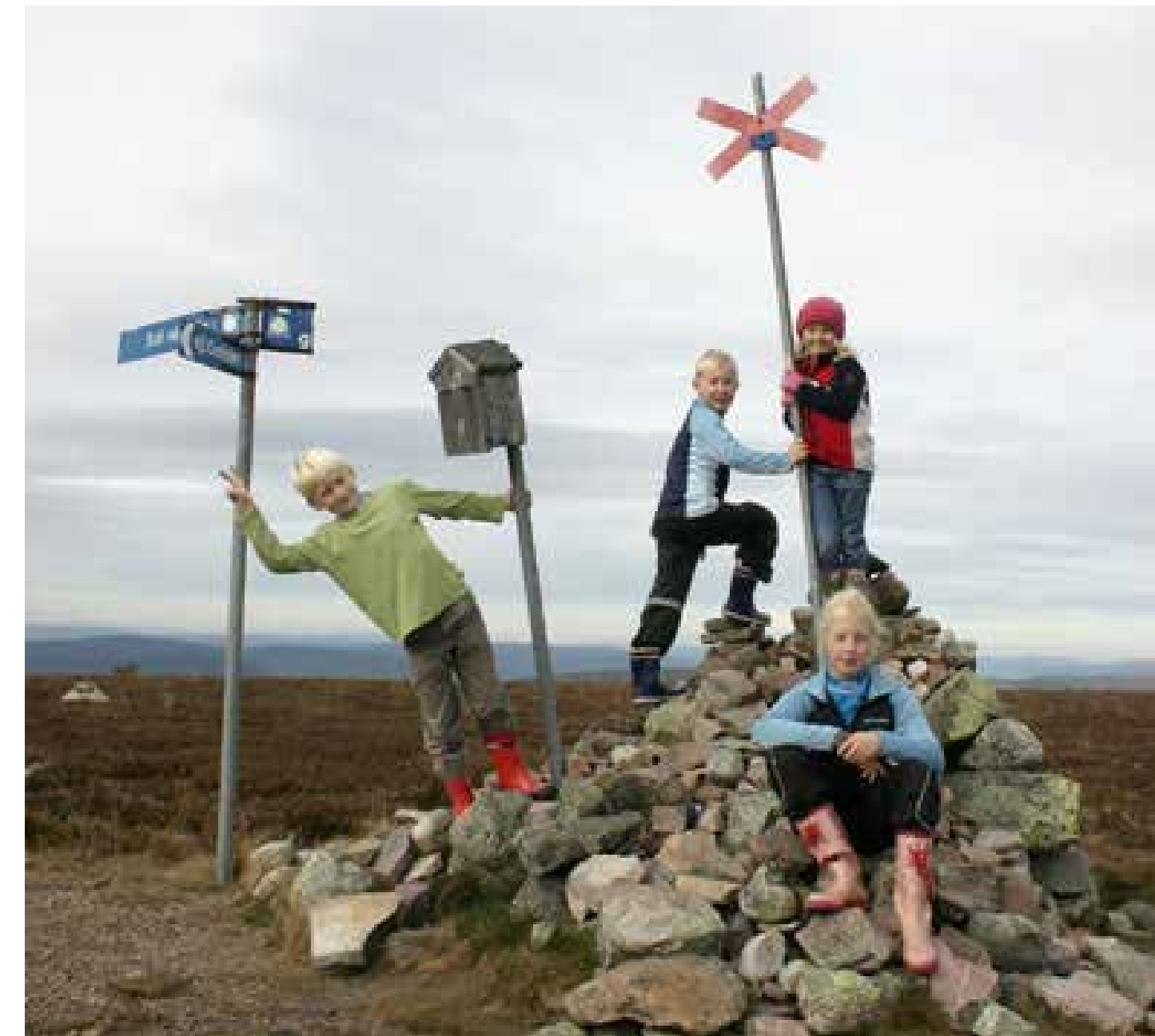
Transtrandsfjällen är lättillgängliga. Här finns flera bra leder, rastplatser och raststugor.