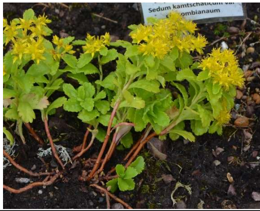
2057 Japanskt fetblad