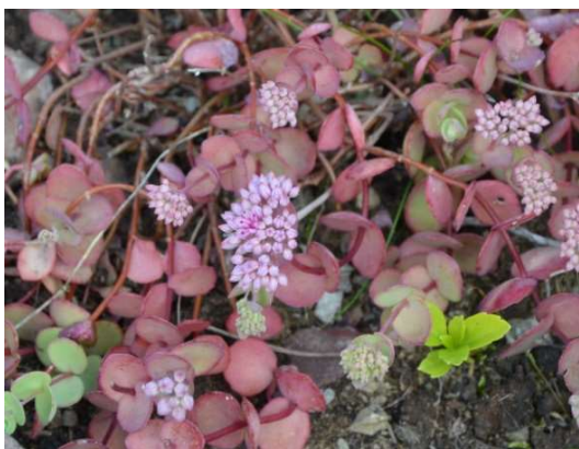
1395 Mongoliskt fetblad