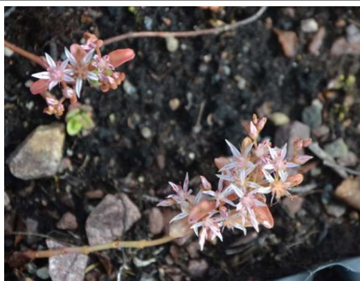
1478 Röd kärleksört