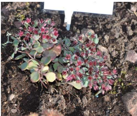
2246 Liten kärleksört