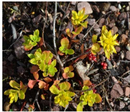
809 Kamtjatka fetblad