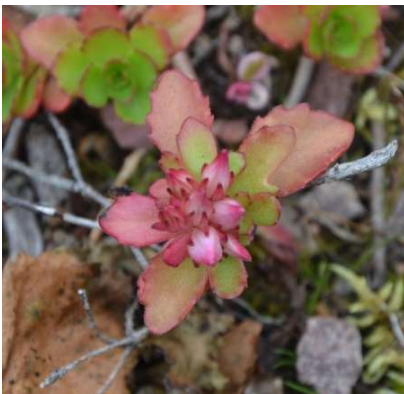
104 Kaukasisk fetblad