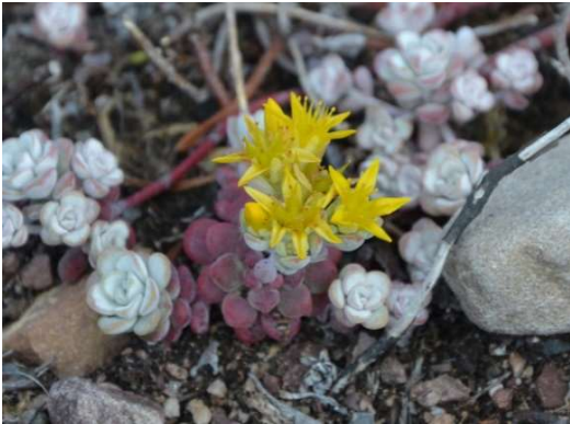
1229 Kalifornisk fetknopp