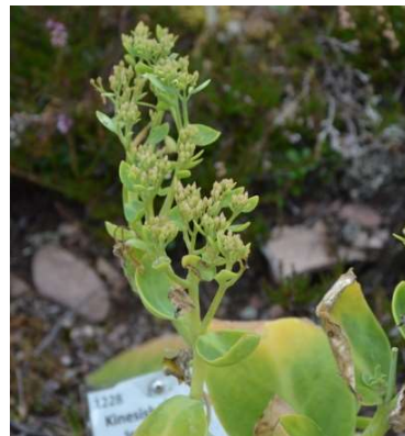
1228 Kinesisk kärleksört