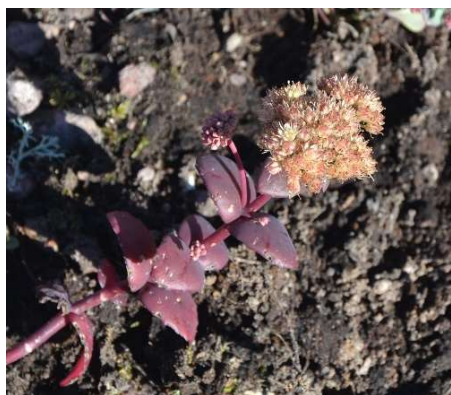
2058 Finsk kärleksört