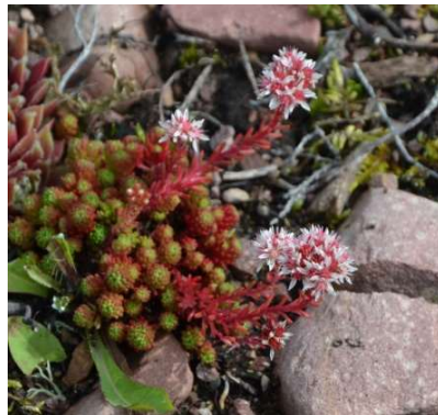
1231 Lydisk fetknopp