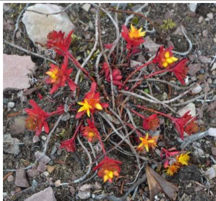
1233 Sibiriskt fetblad